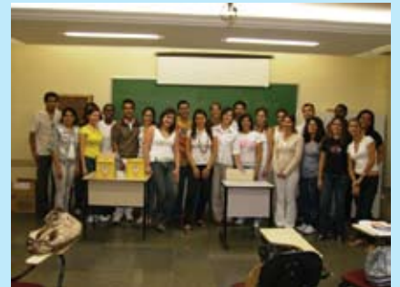
Turma do Curso de Aplicação de Injetáveis

• Aplicação de Injetáveis O Curso de aplicação de injetáveis promovido pelo Sinfarmig em parceria com a empresa BD – Becton Dickinson nos dias 7 e 8 de maio foi um grande sucesso entre a categoria. Este foi o primeiro de uma série de cursos que o Sindicato vai oferecer aos profissionais sindicalizados ao longo deste ano, sempre em busca de benefícios e aprimoramento profissional para os farmacêuticos.