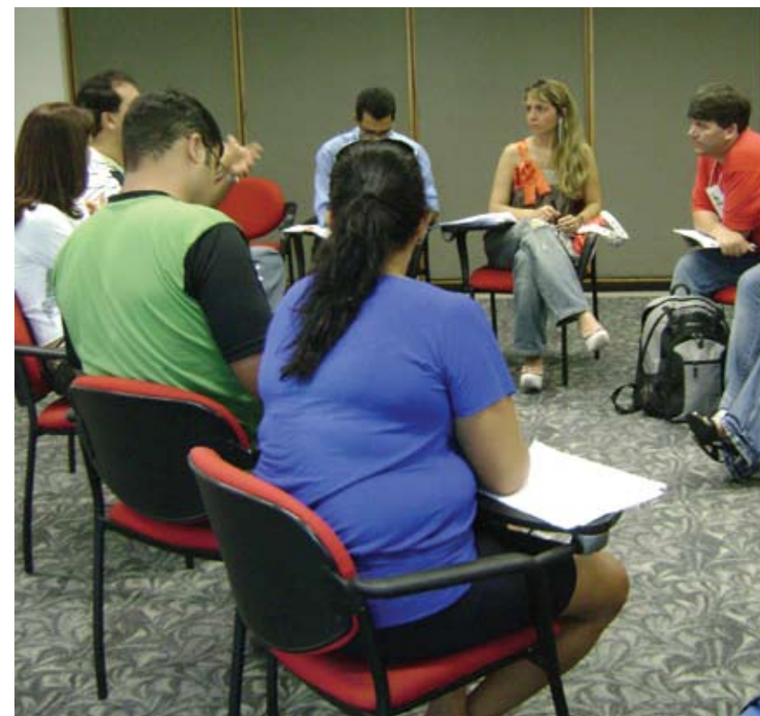
Grupo de discussão do Plano de Ação de 70 dias

O Sinfarmig, em sua luta constante por uma saúde pública de qualidade, chama os colegas a se unirem e formarem em sua região grupos de profissionais para negociar junto as GRS a inserção do farmacêutico nos NASF.