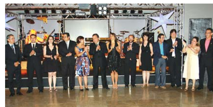
Apresentação da nova diretoria