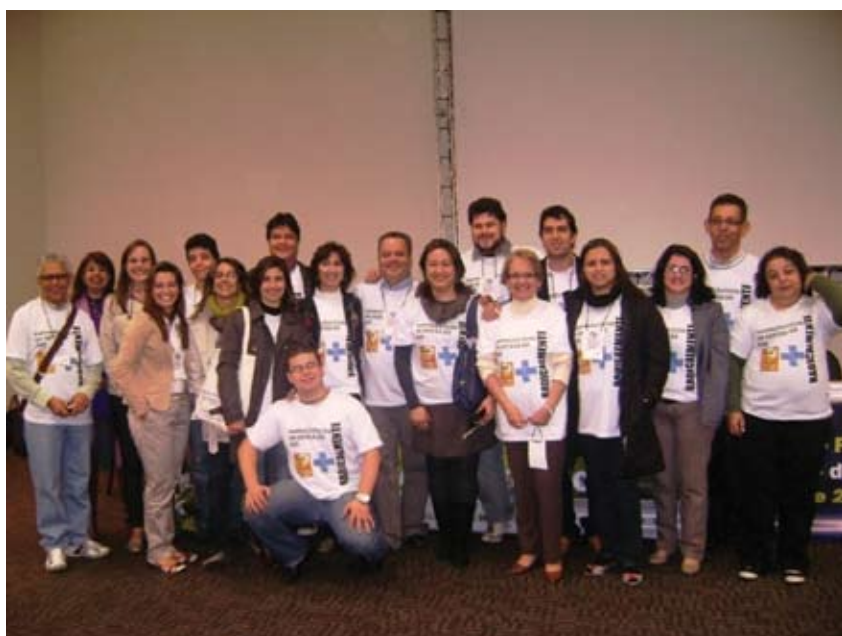
Farmacêuticos mineiros à favor dos SUS

Propor, discutir, defender e construir proposições alinhadas com a defesa da saúde da população e do papel do farmacêutico no processo de atenção à saúde.